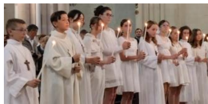
Joie d'exprimer notre foi en Dieu, de croire à son Amour !